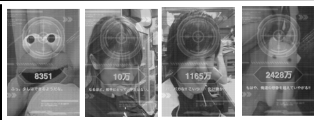
以外に高得点 やはり潜在能力高!2位に入った! Softbank 犬が1位

Check it out baby! くにはるのHomepage http://homepage3.nifty.com/kuni12/ 勝山OB会 http://katsuyamaob.web.fc2.com/