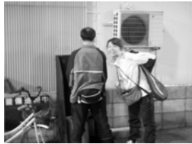
事件現場のジャイアン屋台

第一次細目戦争勃発! キング仲裁! 一週間前のマスターズ大阪場所後、マサトは横綱俵夫妻の推薦でミナミたつたやで飲み会、激しく飲んだ後、かなり全員できあがった状態。そして二軒目はジャインアン屋台に突入!メインバーは荒木夫妻、川村カッブル、若干ウキギミの町田。アサビキ鳥の盛り合わせを頼んだ後、町田の様子を豹変。ナマニクを撒き散らし、他の客に絡むなどの奇行に隼斗がブチ切れ。ムナグラを捕まれバトル勃発、とっさに出た本音の応酬。隼斗を、「おい、チンピラ」「この細目野郎」と叫ぶ始末。仲裁を買ってでたのはスーパードン荒木氏。結婚式の二次会司会と幹事の第一次細目戦争でした!! 記事 細目氏