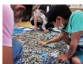
雨天や移動が難しい場合は、室内対応が可能

沖縄の海岸はどこでも火山からの軽石を探ることができます。軽石の種類を覚え、海を流れてきた様々な軽石、鉱物や生物が付いている軽石を探してみます。