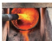
真っ赤な溶岩状態になる実験工程は圧巻

軽石が美しいガラスになる人気の体験プログラム。ガスバーナーを使い軽石を1000℃まで熱して溶かし、透き通るガラス玉に加工していく実験工作です。