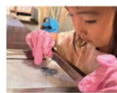
世界でたったひとつのオリジナル作品になる

UV レジンを使って軽石を閉じ込めるアクセサリ作り。青い沖縄のサンゴ礁に浮かぶ軽石をイメージ。軽石は生き物運びサンゴ礁を豊かにする学びと共に。