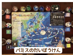
パミスのだいぼうけん

軽石と生態系のつながり、海流の仕組みを遊びながら学べるオリジナルのボードゲームです。幼児から小中学生、大人まで楽しみながら環境学習を行えます。