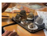
オブジェとして自宅に飾っても美しい標本

100年に一度と言われる海底火山からの軽石漂着。今しか手に入らない多様な形状の軽石をコレクションとしてケースに並べ、標本作りに挑戦します。