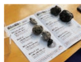
軽石を分類できるワークシートを使用

海底火山「福徳岡ノ場」から噴出した軽石について、形状や色での分類に挑戦します。顕微鏡で観察することで、軽石の構造や含まれる鉱物を理解します。