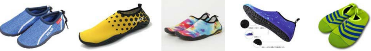
✕ 生地や底が薄いもの ✕ つま先や側面が広めにゴムなどで覆われていないもの

悩んだら公式LINEで、商品を購入する前にスタッフへ写真を送って聞いてみてください！