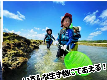
いろんな生き物にであえる!