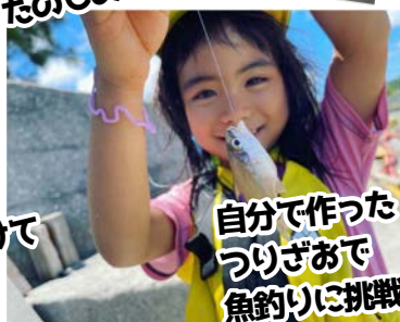
自分で作った つりざおで 魚釣りに挑戦