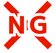
✕ ぞうり、スポーツサンダル、クロックス、長靴