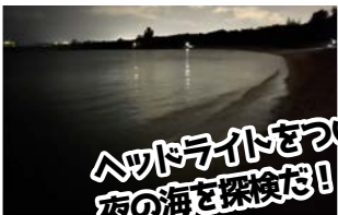
ヘッドライトをつけて 夜の海を探検だ!