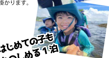
はじめての子も たのしめる1泊