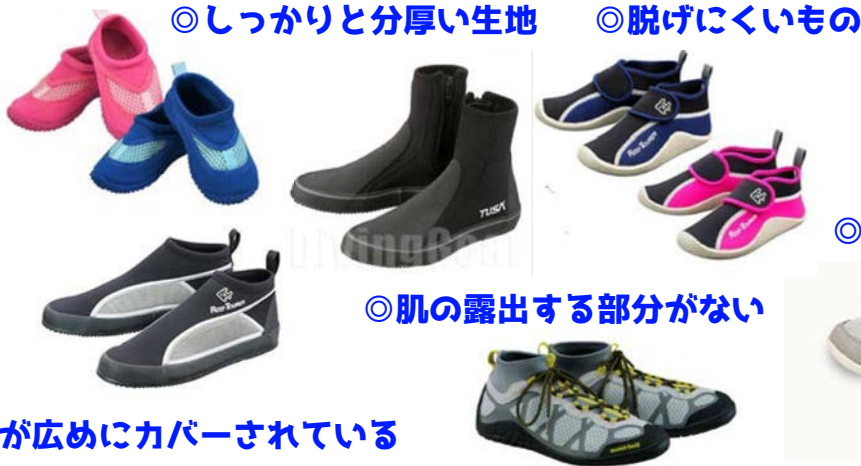
◎つま先や側面が広めにカバーされている