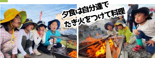
夕食は自分達で たき火をつけて料理

◎料金には、期間中の食費、宿泊費、プログラム料、機材レンタル料が含まれます。 当教室の保険に加入されていない子は、別途保険加入料 1,450円が掛かります。 ◎兄妹で参加の場合は各10%割引