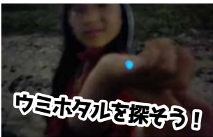
ウミホタルを探そう!