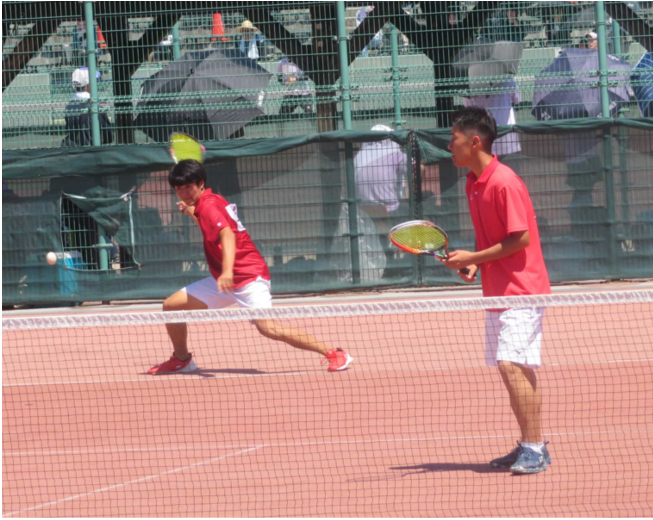
山西・勝山・・・5回戦進出（ベスト32）