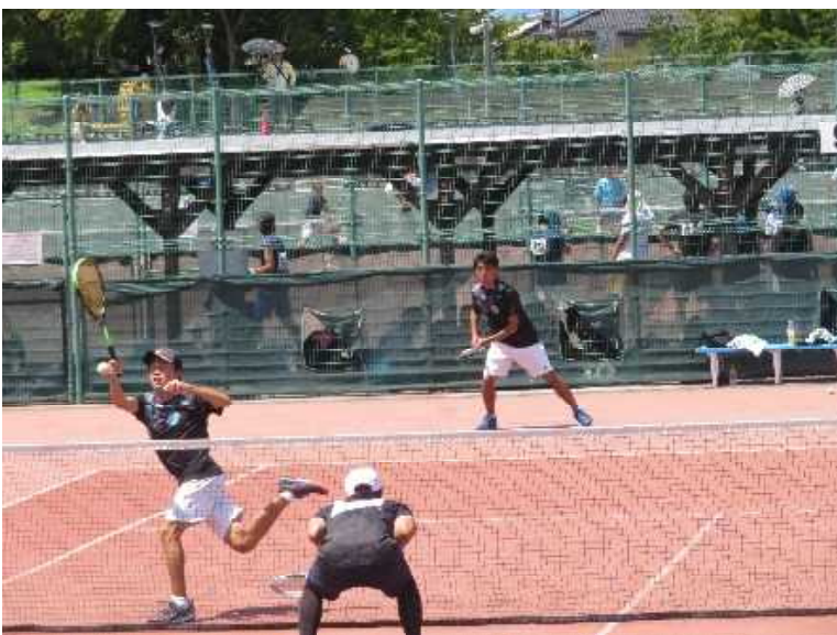
飯塚・前田ペア（4回生）・・・惜敗・・・