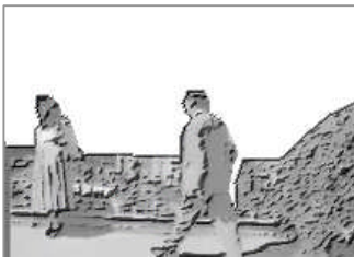
(見つけた)ここにいたんだ!