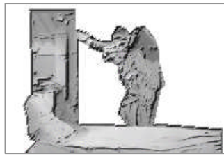
(準備ができた)さあどうぞ。