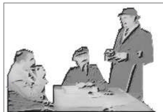
それ見たことか(言った通りだろ)