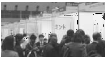
特許庁主催の特許フェアに3日間でのべ1万1千人が来場（東京ビッグサイト）

足早に通る過ぎようとしていた来場者が、ふと足を止めた。その視線の先にあるスクリーンには、歌にあわせて歌詞が表示されている。それだけが、彼女を立ち止ませたのでない。手をかざすと、位置がスワッシュと次の一