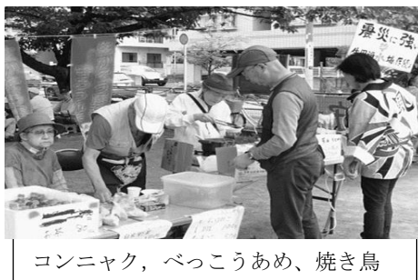
コンニャク、べっこうあめ、焼き鳥