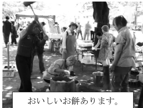
おいしいお餅あります。