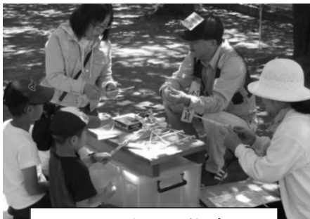
子どもの広場で遊ぼう