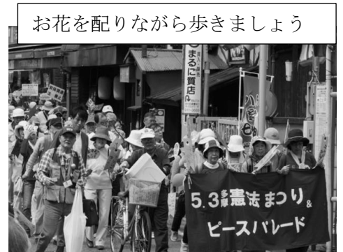
お花を配りながら歩きましょう