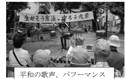
平和の歌声、パフォーマンス