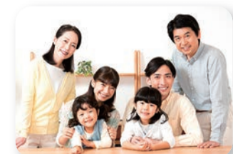
医療体制の一層の充実を