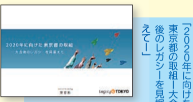
「2020年に向けた東京の取組大会後のレガシーを継承」