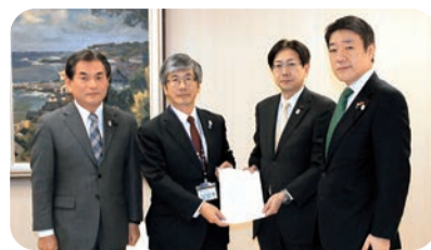
中小企業支援策の緊急要望を副知事にする 都議会自民党三役 (H27.11.25)