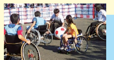
全国に先駆けた取り組みを推進