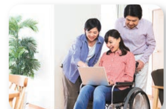
地域生活を支える基盤整備を推進