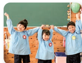
保育待機児童、いよいよ解消へ