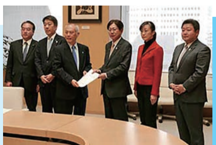
都知事に新年度予算の復活要望をする都議会自民党役員

本年1月、東京都が当初作成した平成28年度予算原案が公表されました。都議会自民党は原案に対し、区市町村への支援、都民生活の安定、地域産業の活性化等の視点から総額200億円の予算復活要望を都に申し入れた結果、全額が平成28年度の都予算として計上されました。