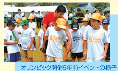
オリンピック開催5年前イベントの様子