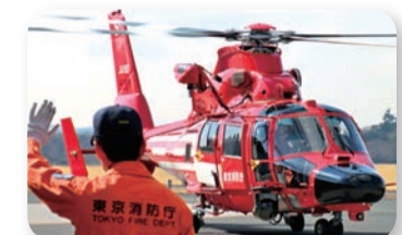
防災対策の徹底強化に全力