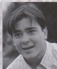
川平 慈英(ジョージ)