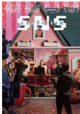
©2020 Hypermarket Film, Czech Television, Peter Kerekes, Radio and Television of Slovakia, Belgium Film All Rights Reserved.