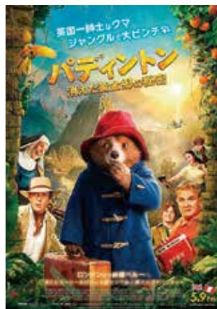
©2024 STUDIOCANAL FILMS LTD.・KINOSHITA GROUP CO., LTD. All Rights Reserved.