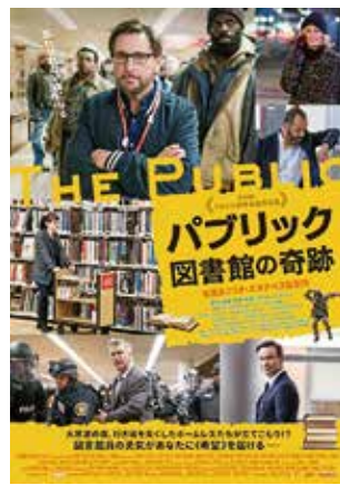
© EL CAMINO LLC. ALL RIGHTS RESERVED.

ナレーション：井ノ原快彦 本上まなみ 65分 子ども・絵本/アニメーション/小学生～一般